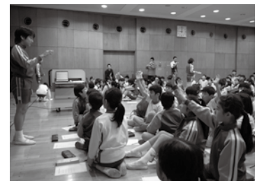
昨年度の参加校、東京都内の小学校での授業風景