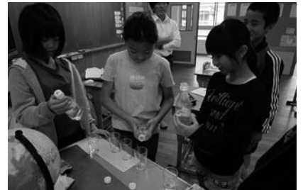
昨年度の参加校、小笠原村立母島小学校の授業風景

ウェブサイト： http://www.jnne.org/gce/ （2015年2月に公開予定）