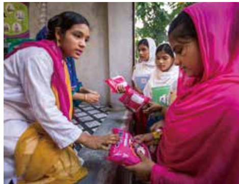
月経ナプキン製造販売店を起業