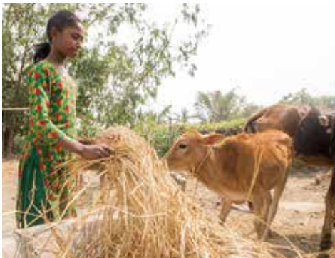
家畜を育てて収入増加