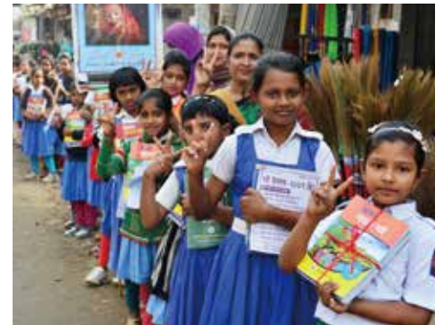
早すぎる結婚の防止を訴える女の子たち