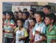
「ロヒンギャ族の子どもの虐待防止」