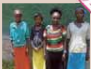
「女性性器切除から女の子を守る」