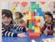
「シリア難民の子どもの教育支援」