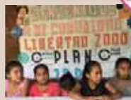
「女の子が安心できる学校づくり」