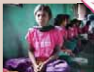
「早すぎる結婚の防止」