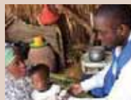
「栄養不良の子どもの食料支援」