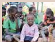
「南スーダン難民の子どもの保護」