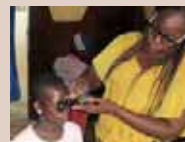
「障がいのある子どもの教育支援」